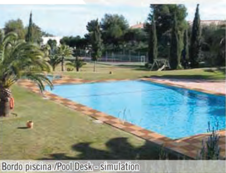
Bordo piscina /Pool Desk - simulation

Είναι ιδανικό για: ακτές, κήπους, πισίνες, πεζοδρόμια